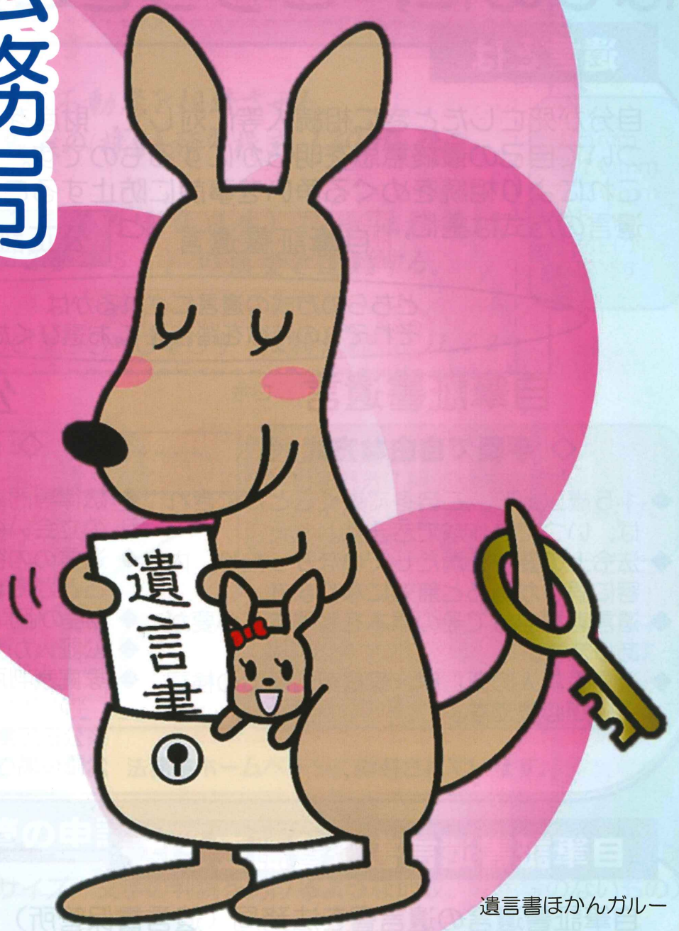
遺言書ほかんガルー